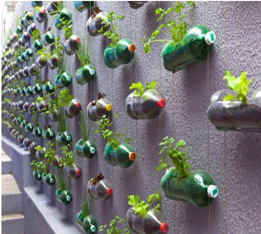
สิ่งประดิษฐ์จากวัสดุเหลือใช้

พอจะทราบกันแล้วว่าขยะที่สามารถนำมาใช้ประโยชน์ได้หรือที่เรียกว่า ขยะรีไซเคิล เราสามารถนำมาทำกิจกรรมภายในชุมชนได้หลายกิจกรรมเพื่อให้ชุมชนน่าอยู่และมีสิ่งแวดล้อมที่ดี ซึ่งยกตัวอย่างได้ดังนี้