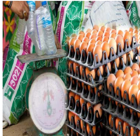
ขยะแลกไข่