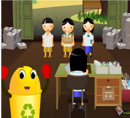
ธนาคารขยะ