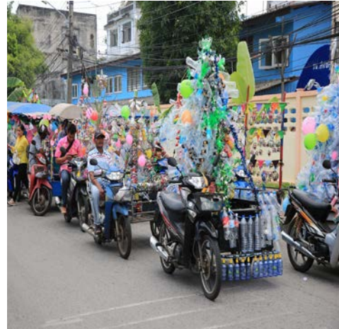
ผ้าป่ารีไซเคิล